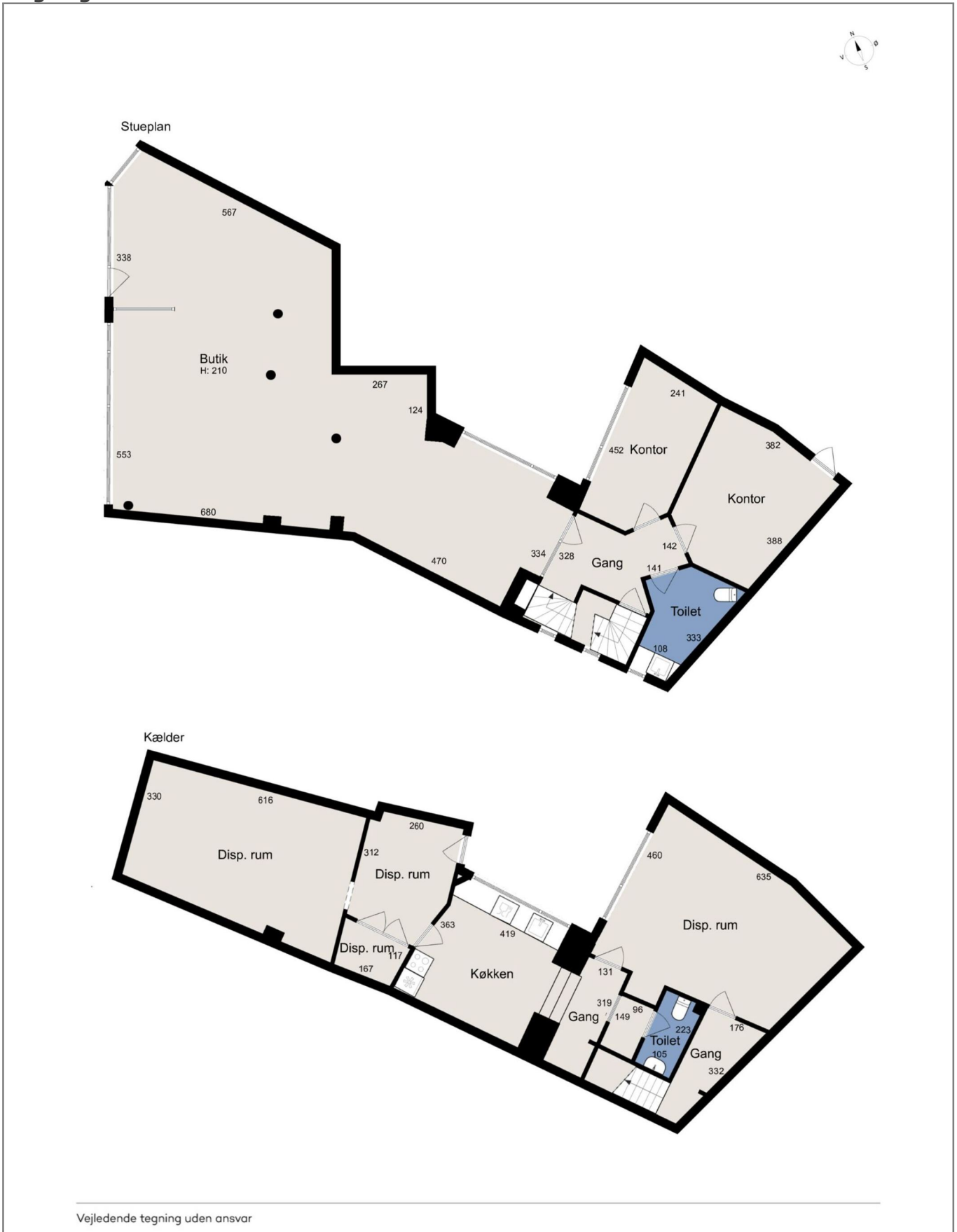
Alle plan (2x3)