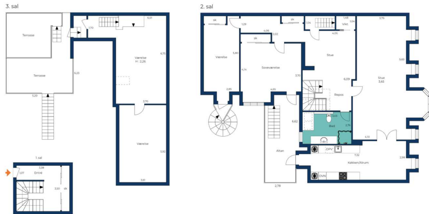
Vejledende tegning uden ansvar.