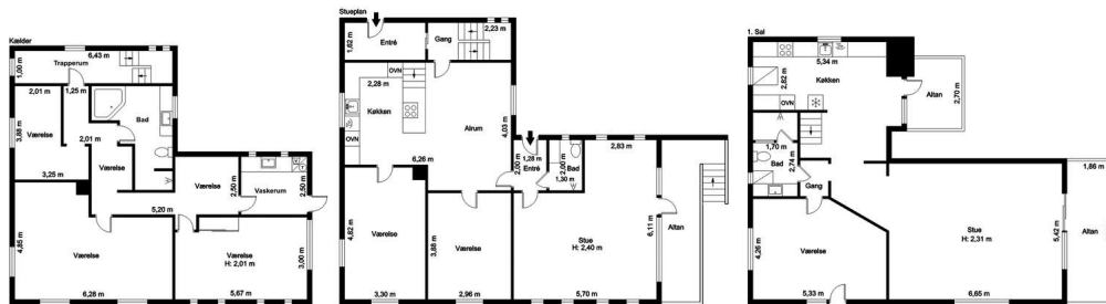
Veiledende tegning, ikke målfast