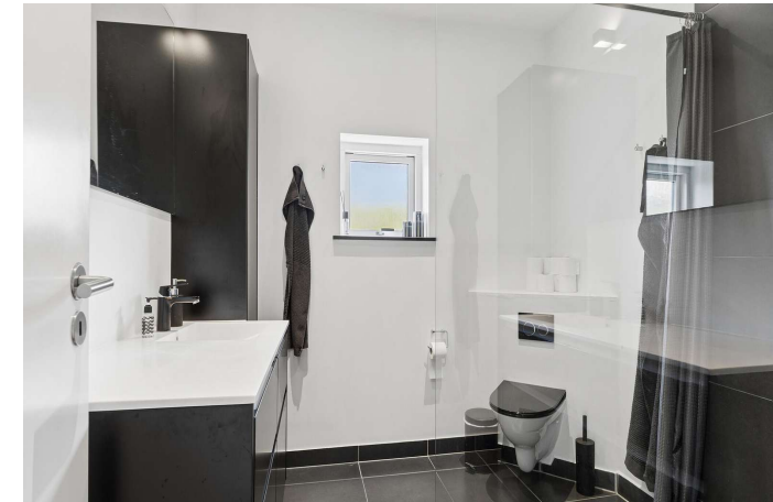
Toilet på alle 3 plan + 2 badeværelser.