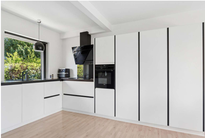
Flot og stilfuldt køkken.