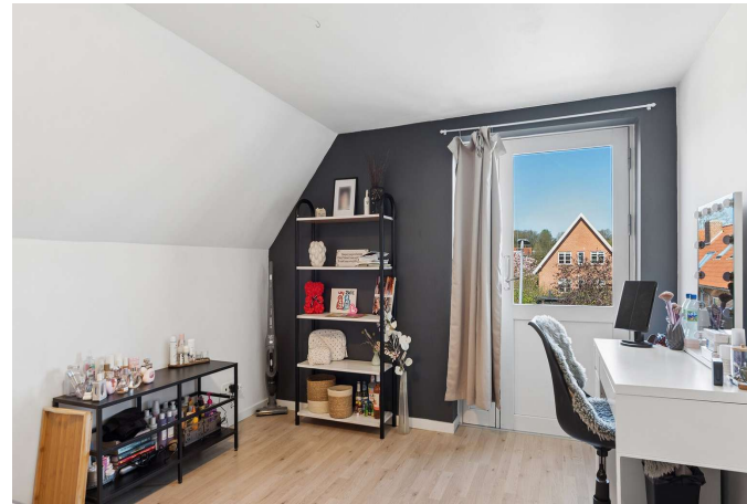
2 gode værelser på 1. sal.