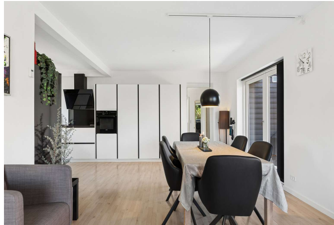
Fra alrum er der udgang til syd-/vestvendt terrasse.