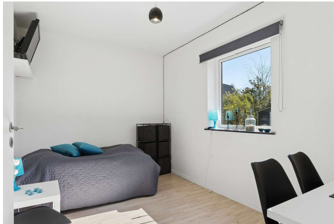
I alt 5 gode værelser.