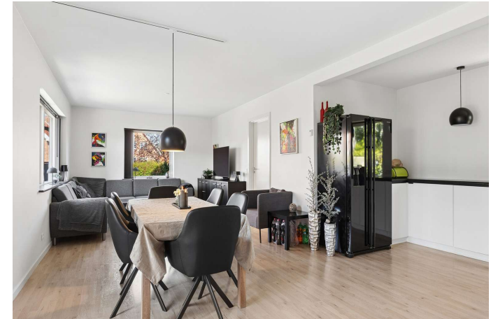
Køkken/alrum i åben forbindelse til stuen.