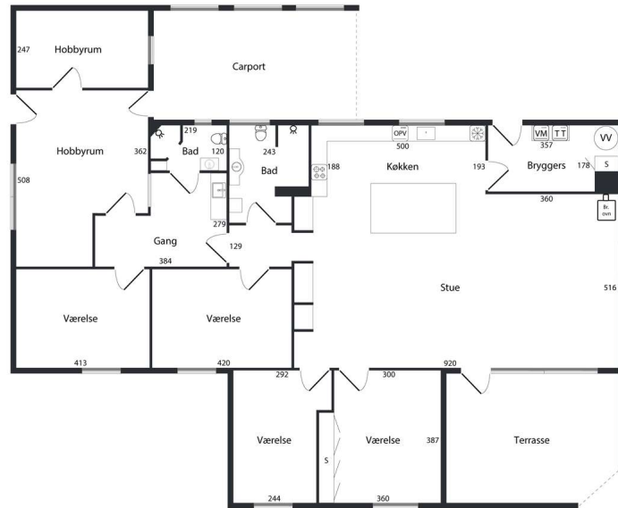
VEJLEDENDE PLANTEGNING UDEN ANSVAR BOLIGFOTOBYN