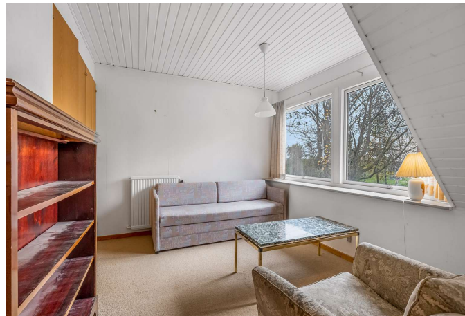
Værelse (1. sal)