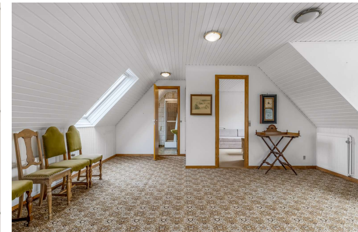
Stue (1. sal)