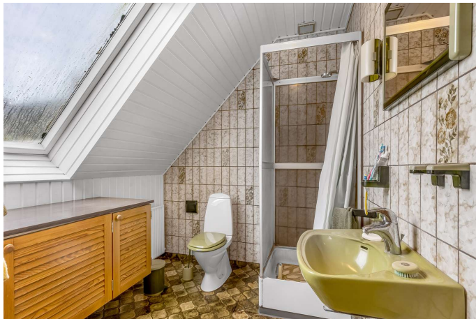
Badeværelse (1. sal)