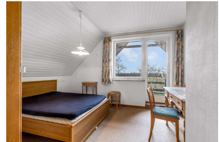
Værelse (1. sal)