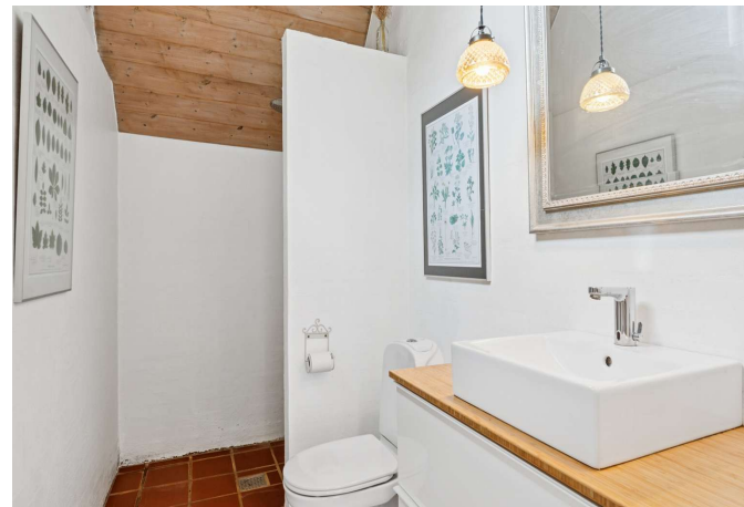
Badeværelse med gulvvarme og loft til kip.