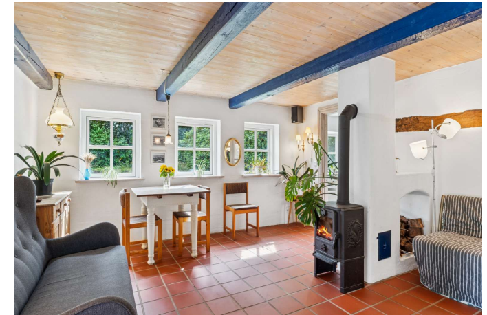
Stue med synlige bjælker og brændeovn