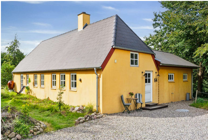
Top charmerende bolig med 14.335 kvm naturgrund