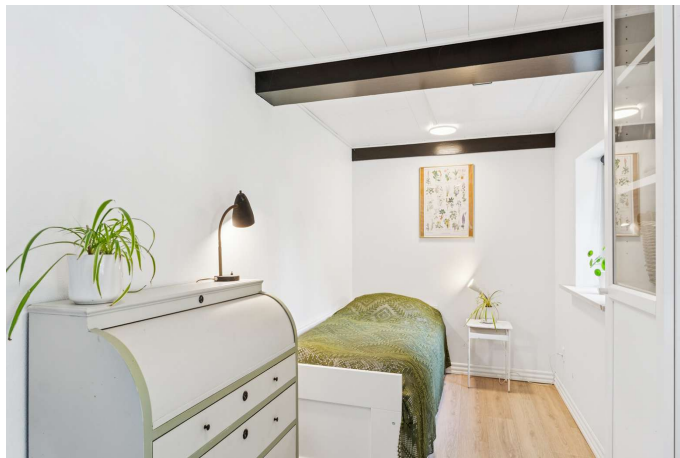
I alt 3 gode værelser + 2 stuer