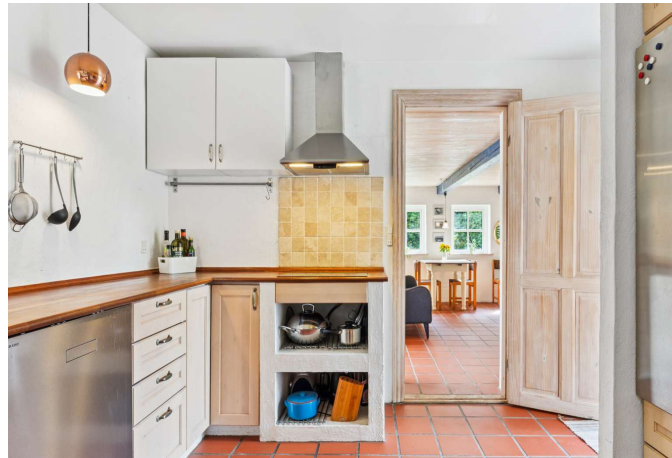
Landlig køkken med gulvvarme