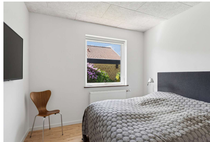
Ét af de ialt 3 gode værelser.