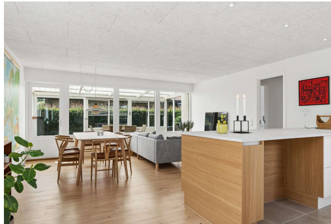
Køkken/alrum er i åben forbindelse til stuen.