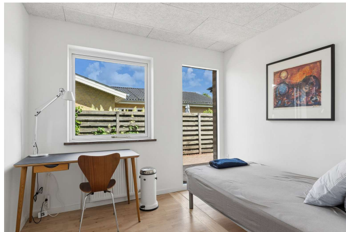
Ét af de i alt 3 gode værelser.