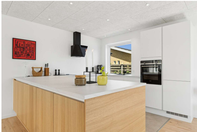
Flot HTH Køkken fra 2026 med gulvvarme.