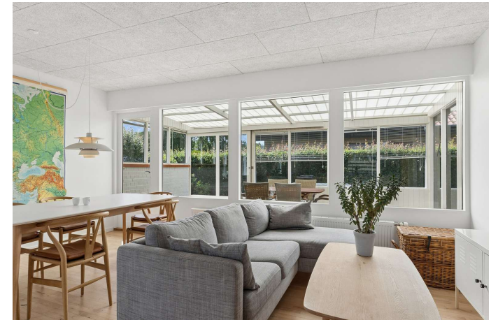
Fantastisk lysindfald og udgang til udestue.