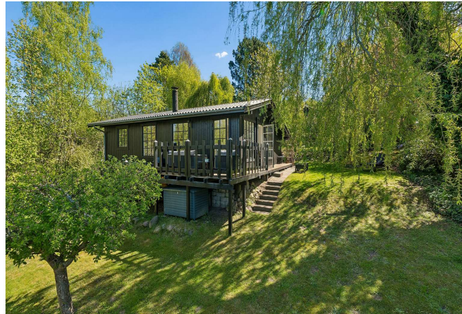
Set fra haven