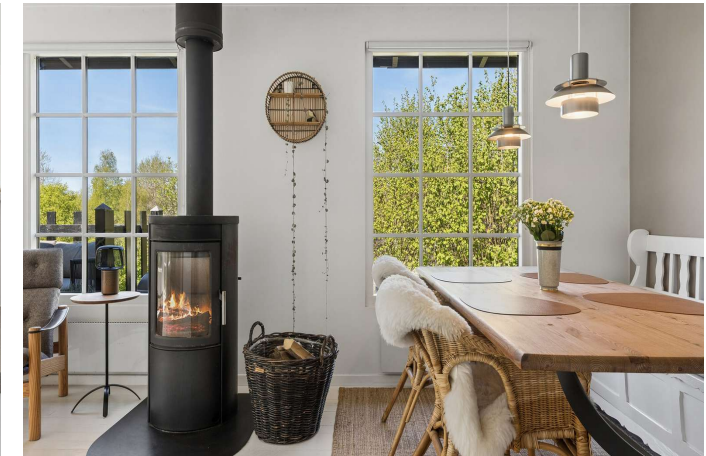
Spiseplads ved brændeovn