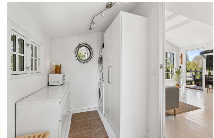
Entré med bryggers