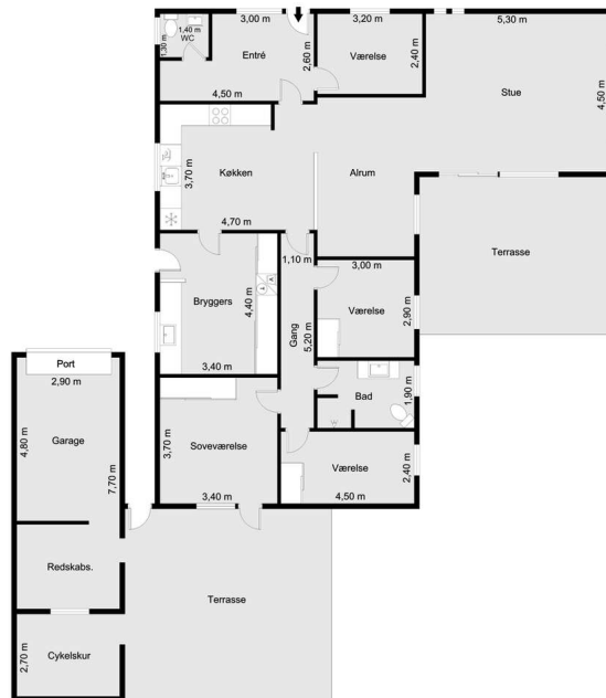
Vejledende tegning uden ansvar!