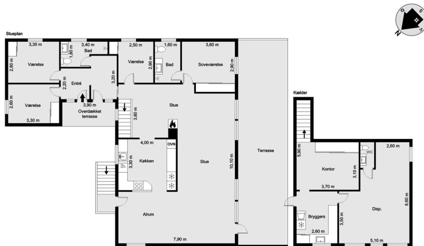
Vejledende tegning uden ansvar! (Profilim.dk)