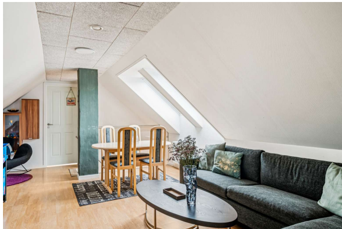
Stue - alrum - aktivitetsrum