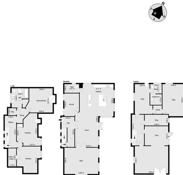
Vejledende tegning uden ansvar! (Profilim.dk)