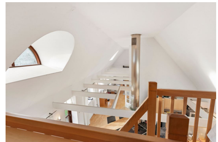
Kig over alrum fra hems