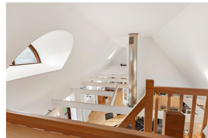
Kig over alrum fra hems