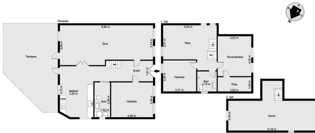
Vejledende tegning uden ansvar! (Profilm.dk)