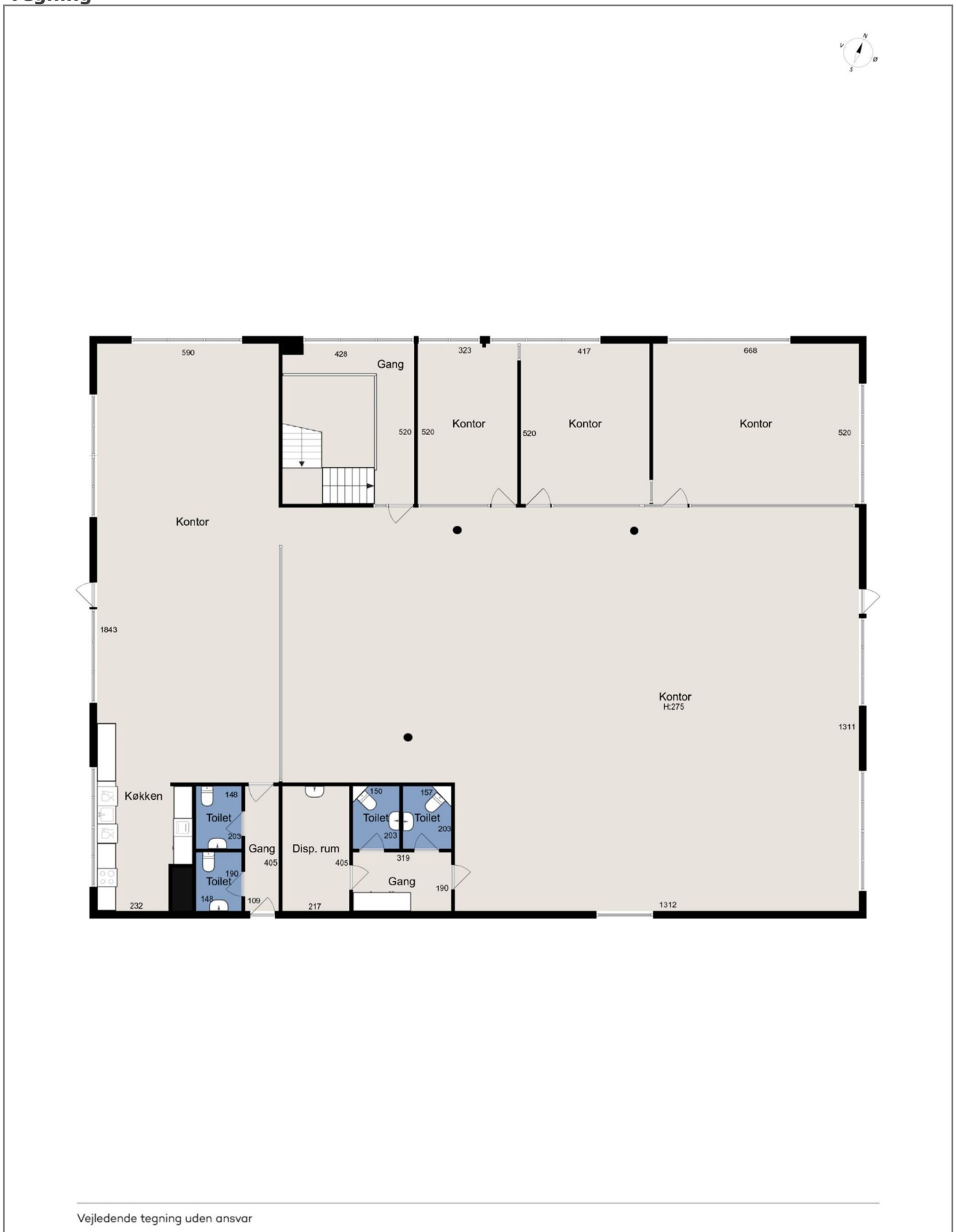
Alle plan (2x3)