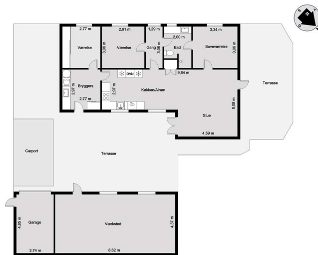
Vejledende tegning uden ansvar! (Profilim.dk)