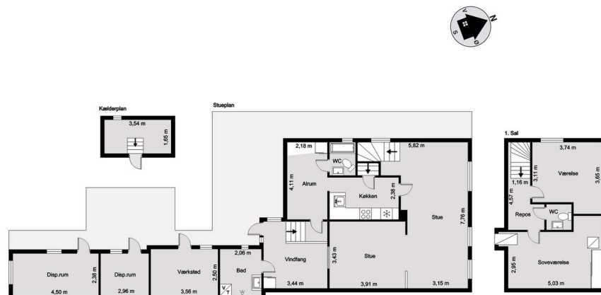
Vejledende tegning uden ansvar! (Profilim.dk)