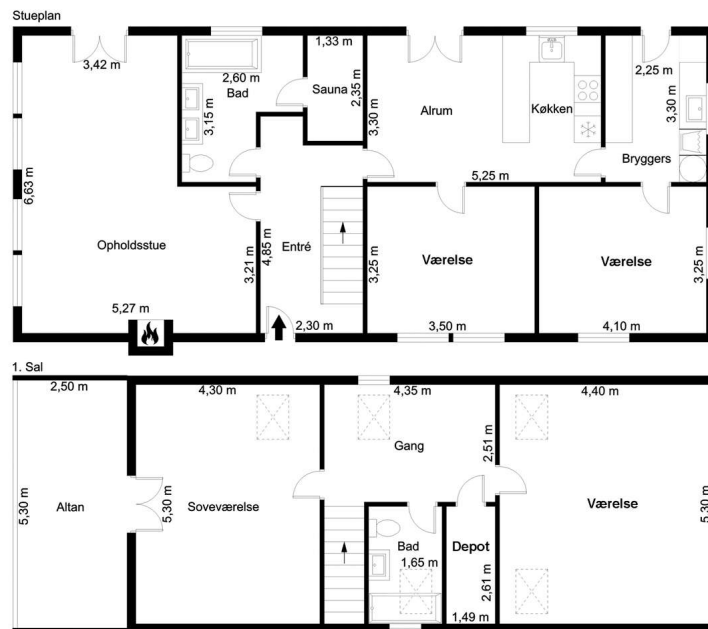
Veiledende tegning, ikke målfast