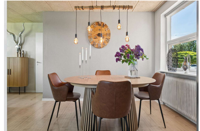
Hygge, charme og skøn natur.