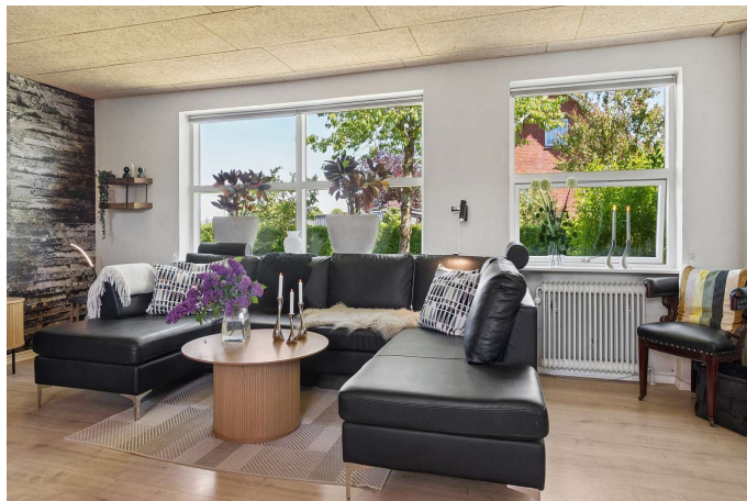
Stue med et skønt lysindfald + brændeovn.