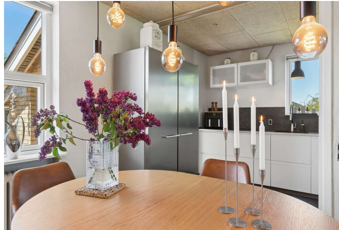
Køkken/alrum i åben forbindelse til stuen.