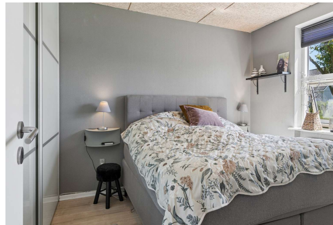
I alt 3-4 gode værelser