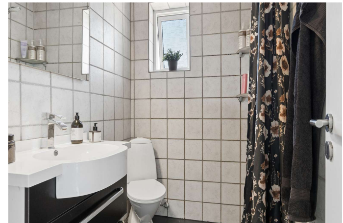
Badeværelse med gulvvarme og brus.