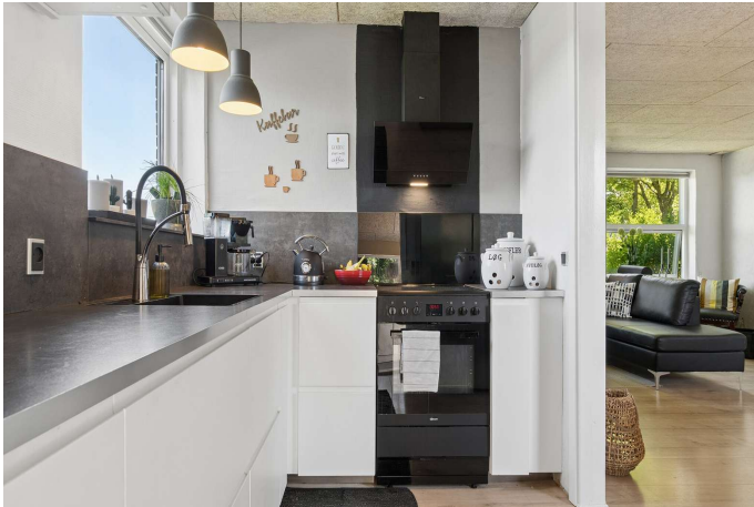
Pænt lyst køkken fra 2020