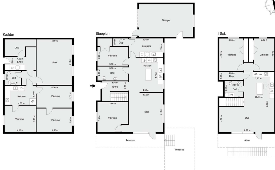
Vejledende tegning uden ansvar!