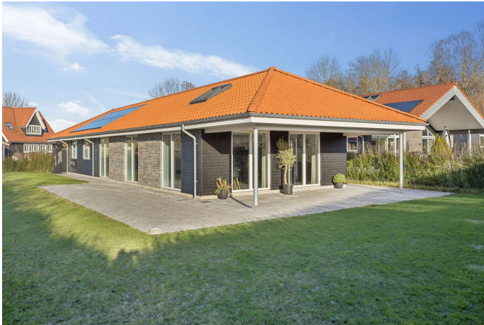
Set fra haven