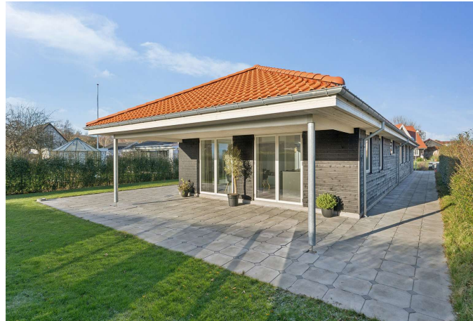
Set fra haven