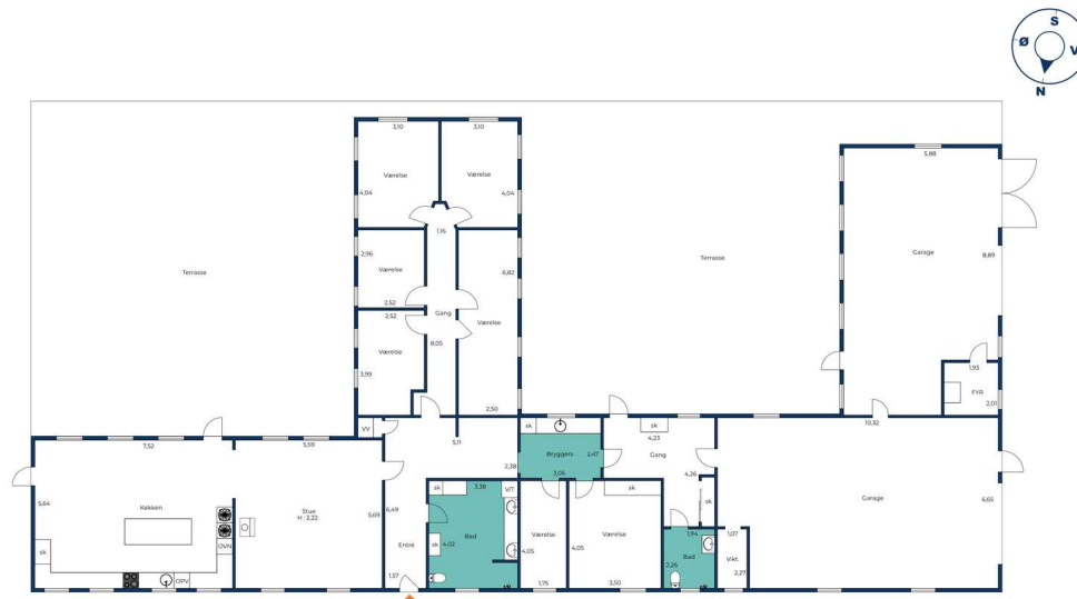
Vejledende tegning uden ansvar.