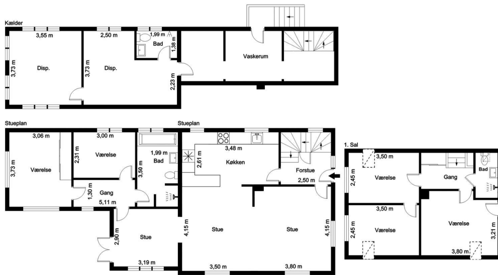
Veiledende tegning, ikke målfast