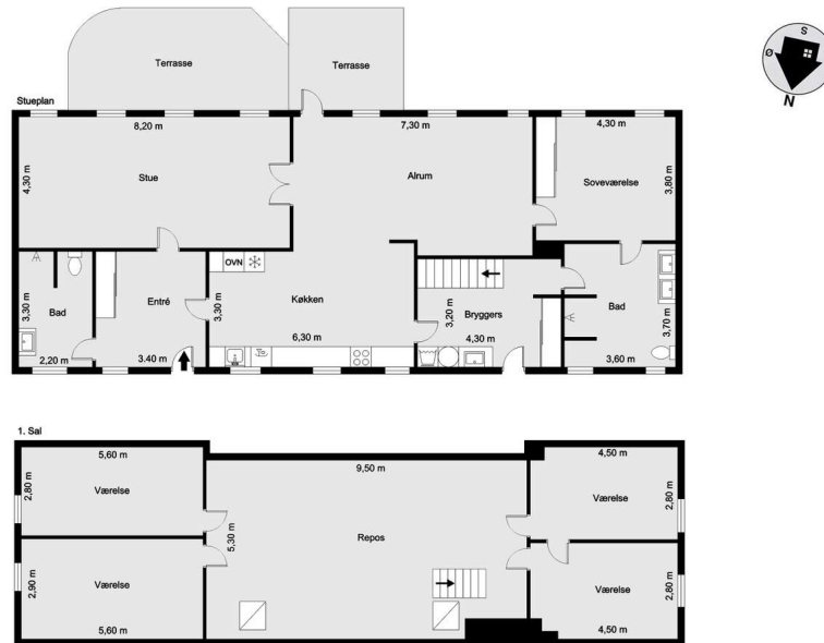
Vejledende tegning uden ansvar!