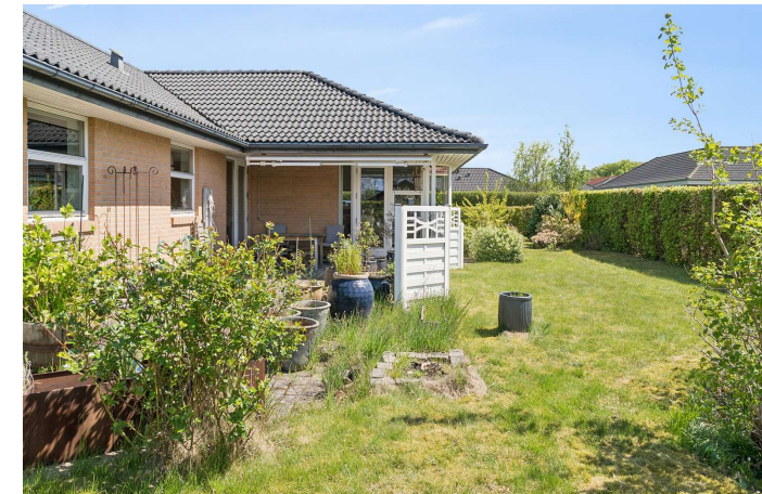
Set fra haven