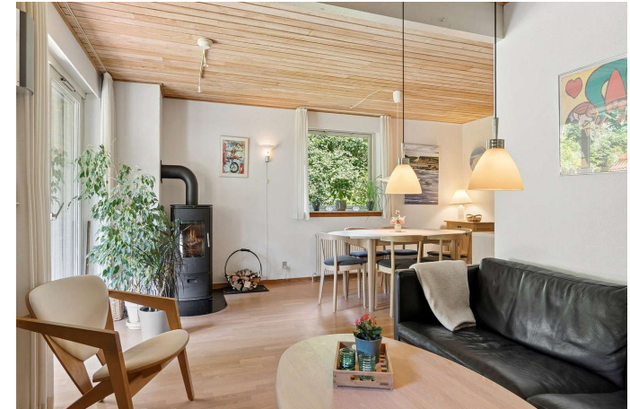
Alrum i åben forbindelse til stuen.