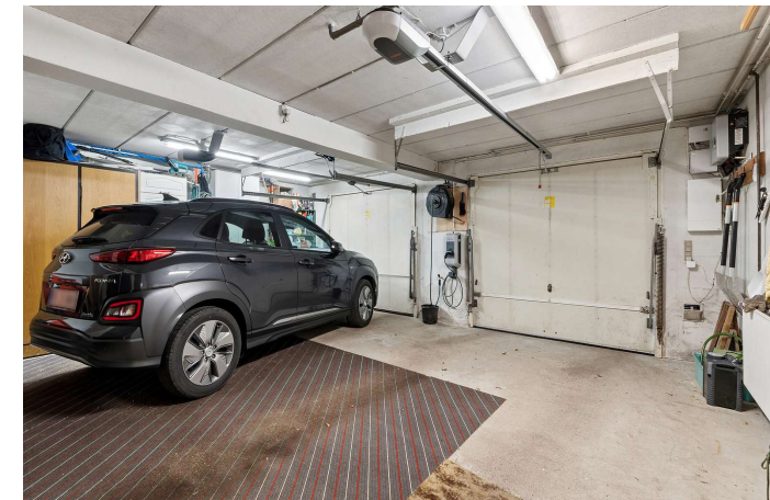
Integreret dobbelt garage.