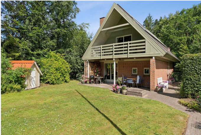
Yderst velbeliggende villa med grund på 1.004 kvm.