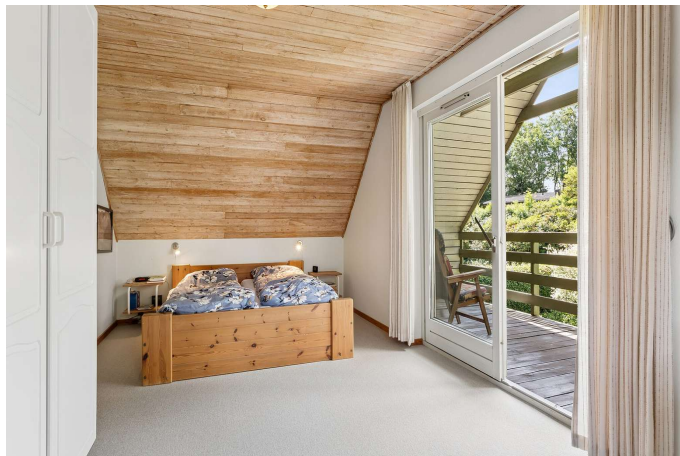
4 gode værelser - heraf et med udgang til altan.