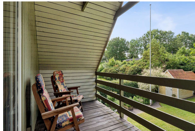
Sydvendt altan med skøn udsigt over haven.