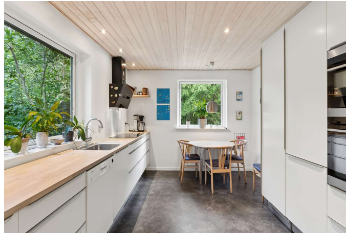
Flot HTH-køkken fra 2017.