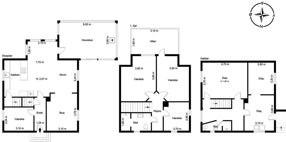
Vejledende tegning, ikke målfast