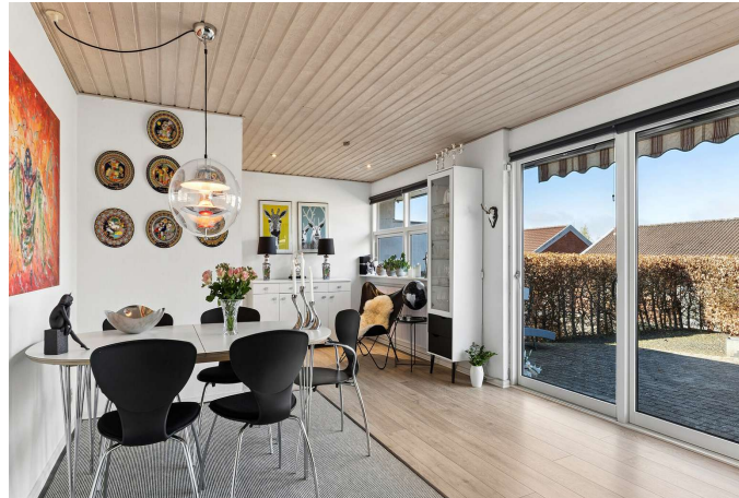
Udgang til vestvendt, ugenert, terrasse/have.