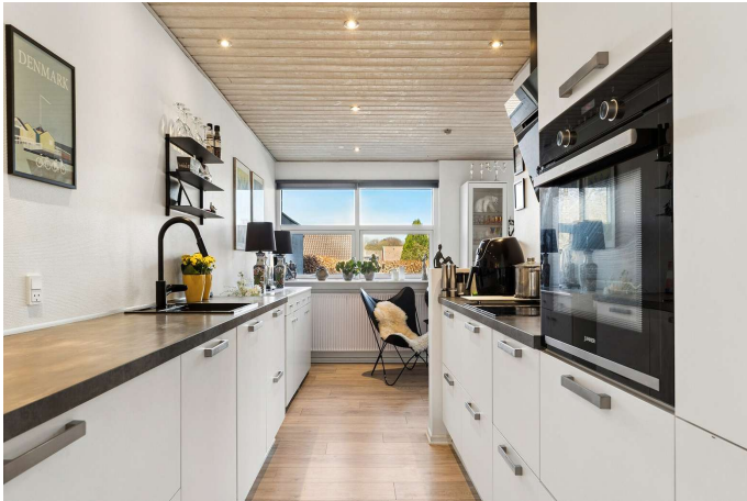
Flot køkken fra 2021.