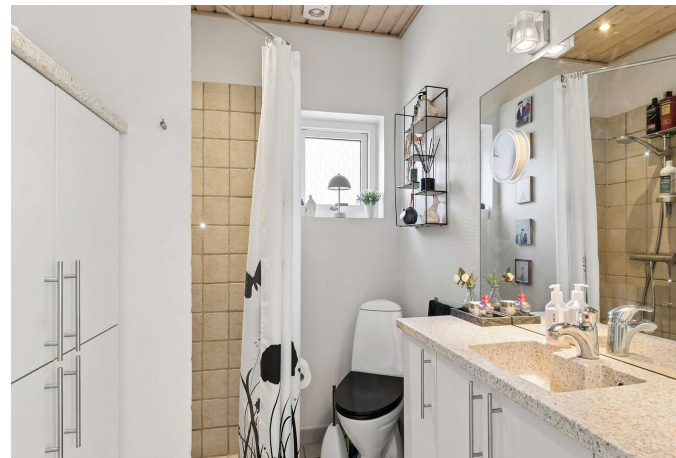
Badeværelse med gulvvarme og brus med lysdioder.