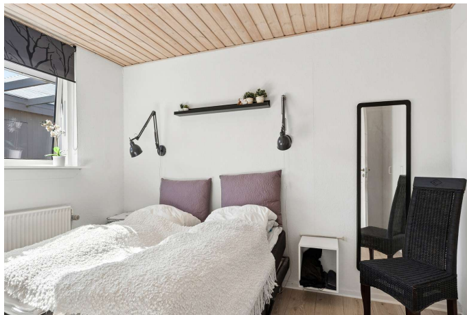
I alt 2 gode værelser