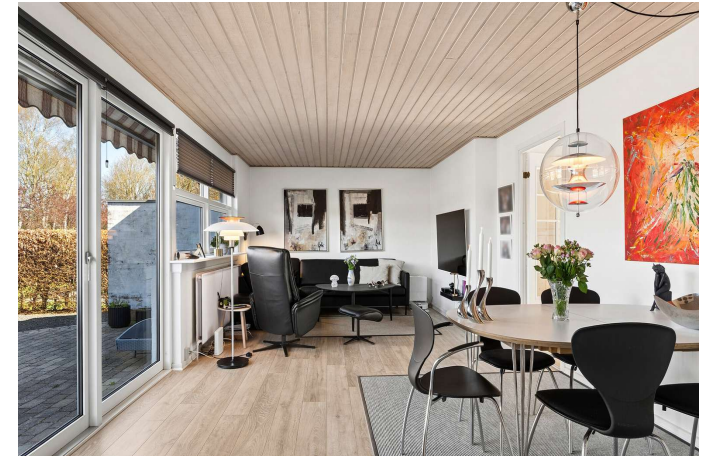
Spise- og opholdsstue med en fantastisk udsigt