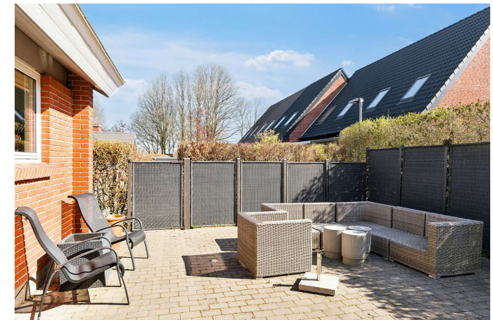
Hyggeligste og ugenerte gårdhave