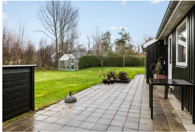
Flisebelagt vestvendt terrasse