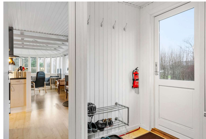
Entre med vaskesøjle