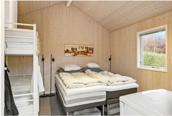
Anneks med 4 sovepladser