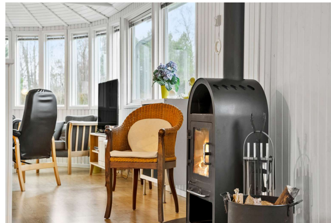
Stue med brændeovn