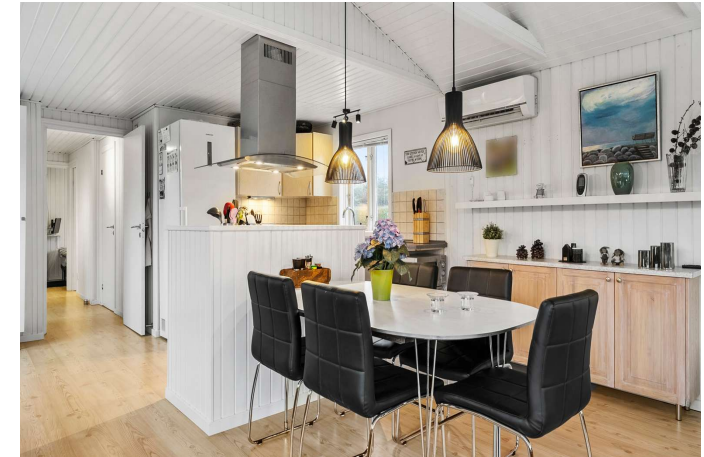
Spiseplads ved køkken