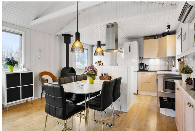
Spiseplads ved køkken