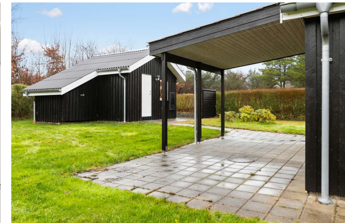
Overdækket terrasse og annek med opbevaringskur