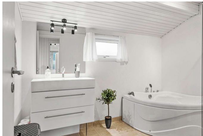
Badeværelse med spabad og bruseniche