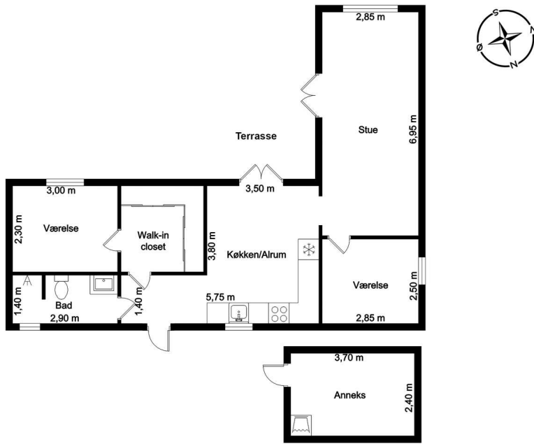
Veiledende tegning, ikke målfast