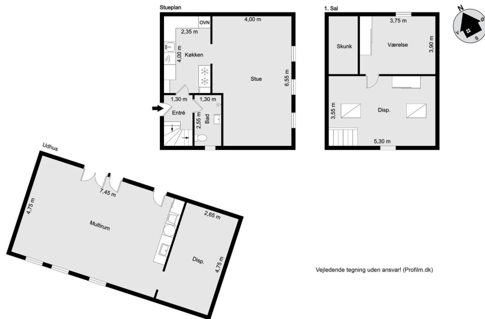
Vejledende tegning uden ansvar! (Profil.dk)