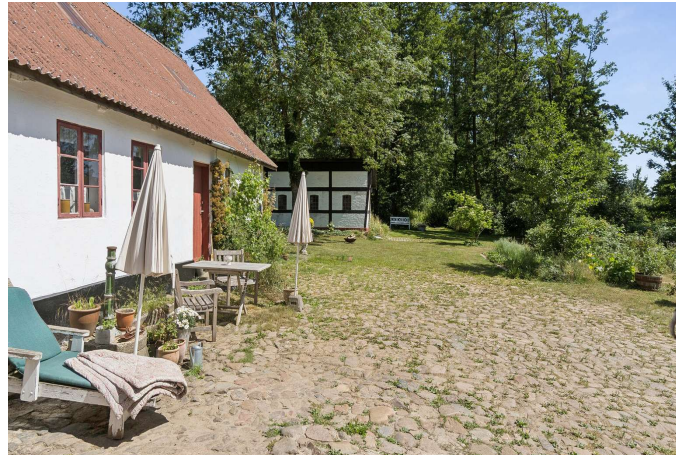
Set fra huset