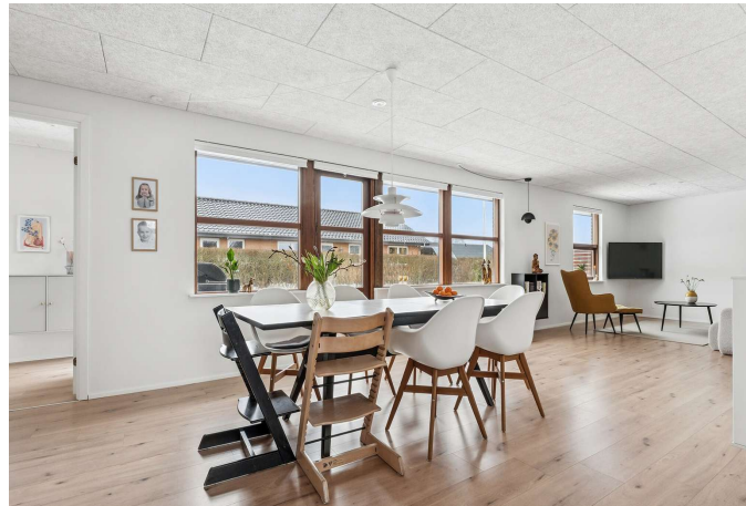
Alrum er i åben forbindelse til køkkenet.