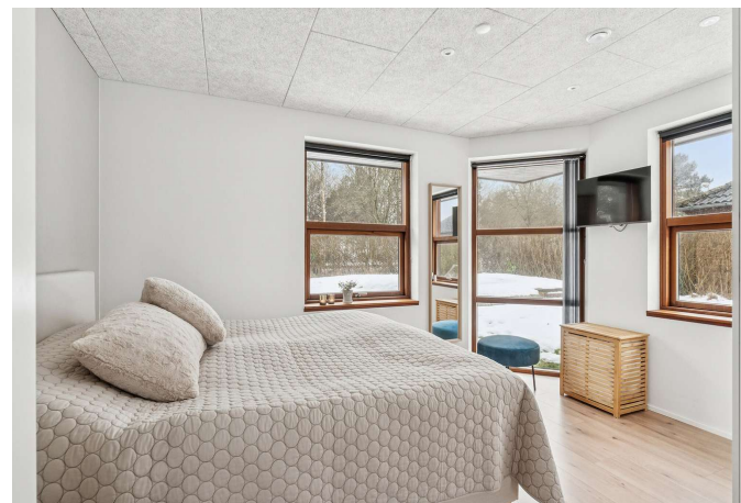
Stort soveværelse med direkte adgang til badeværelse