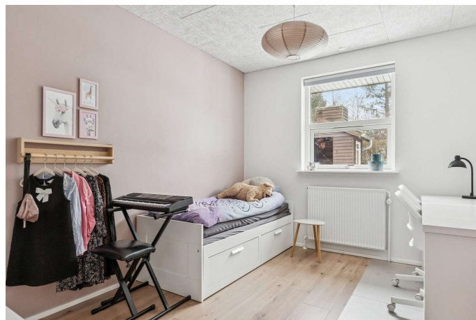
I alt 5 gode værelser.