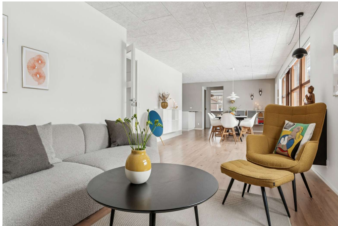
Opholds- og spise-stue med et fantastisk lysindfald.