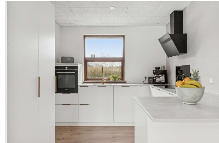
Pænt og stilfuldt Kvik-køkken fra 2021.