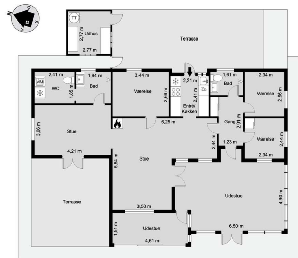
Vejledende tegning uden ansvar! (Profilim.dk)