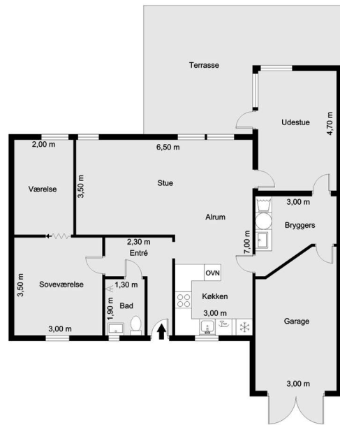
Vejledende tegning uden ansvar!