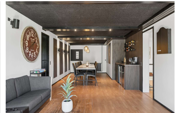
Gildesal, multirum, stue og/eller værelse.