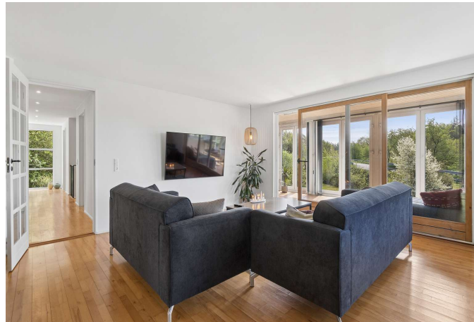
Stue med udgang til svalegang og skøn udsigt.