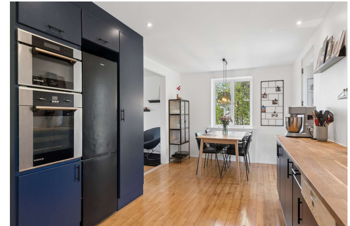
Køkken/alrum med godt lysindfald.