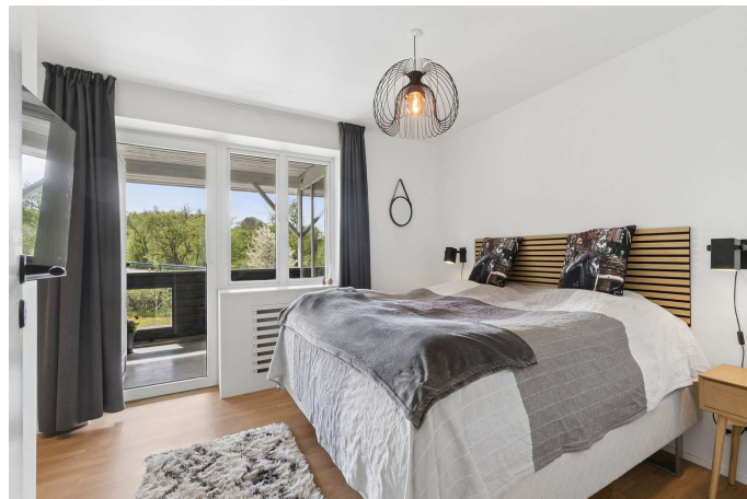
4 gode værelser inkl. soveværelse med walk-in.