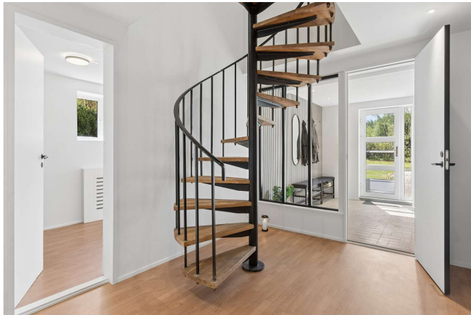
Indbydende og lys entré.