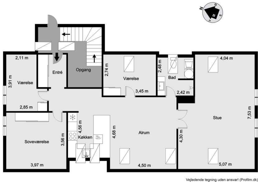
Vejledende tegning uden ansvar! (Profil.dk)