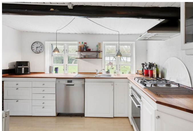
Køkken med udsigt ud til haven