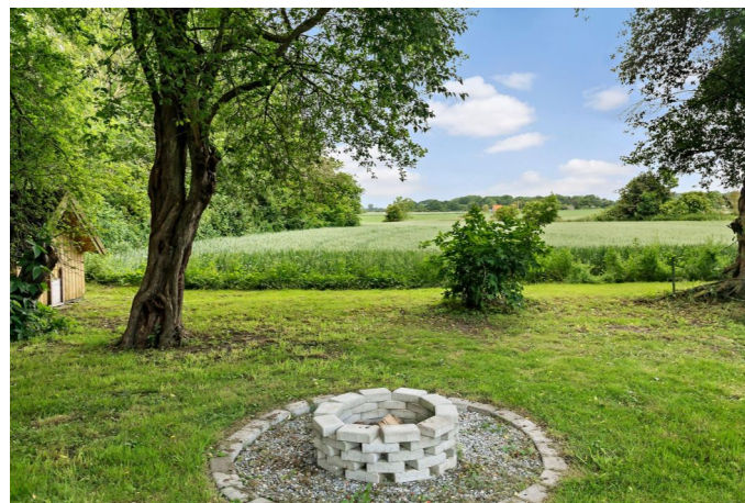
Fantastisk udsigt over markerne