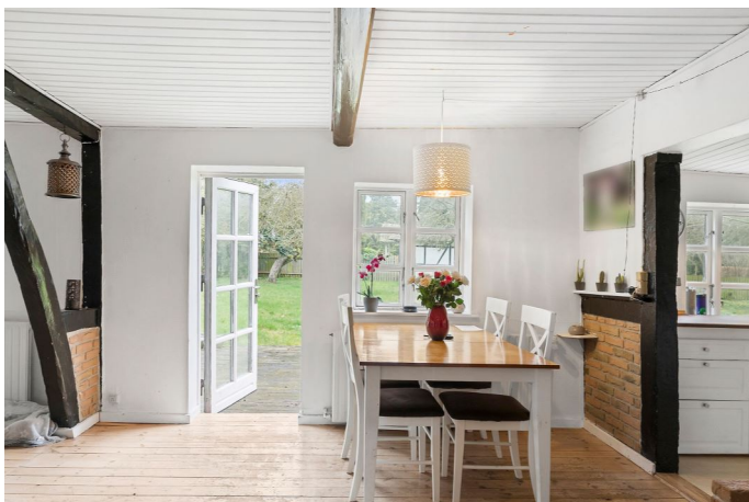
Stue med udgang til terrasse