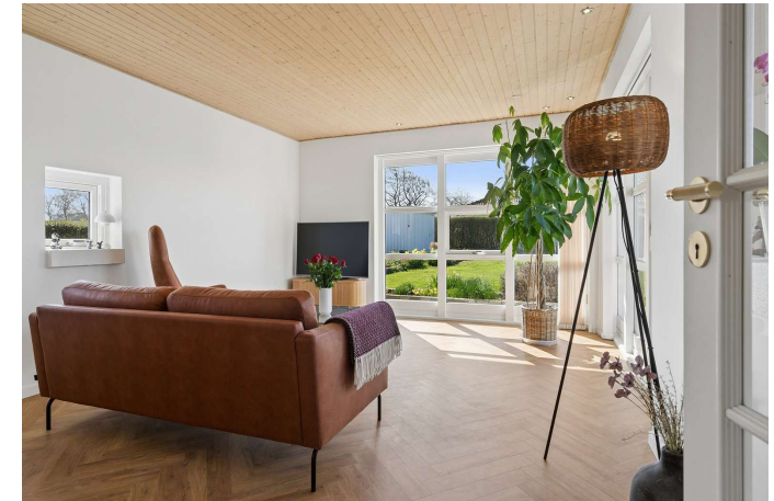
Dejlig lys stue