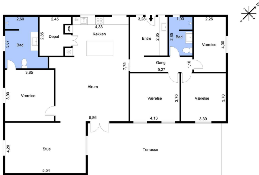
Vejledende tegning uden ansvar