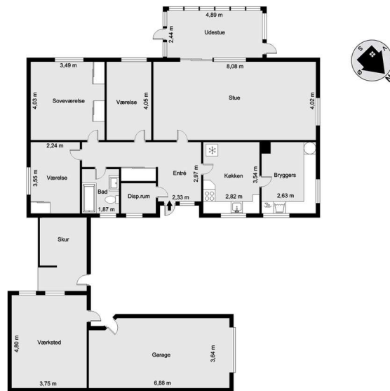
Vejledende tegning uden ansvar! (Profilin.dk)