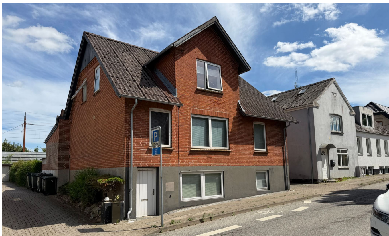
Centralbeliggende lille udlejningsejendom i Hedensted