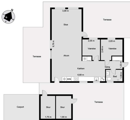
Vejledende tegning uden ansvar! (Profilim.dk)