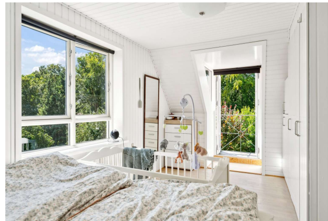
3 gode værelser + underetagen i delvis boligstandard.