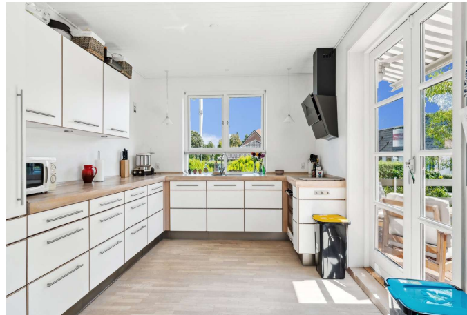
Køkken med udgang til terrasse.