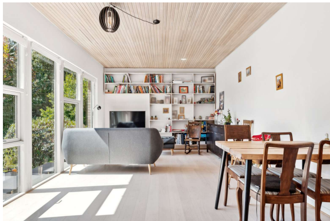
Stue med gulvvarme og et fantastisk lysindfald.