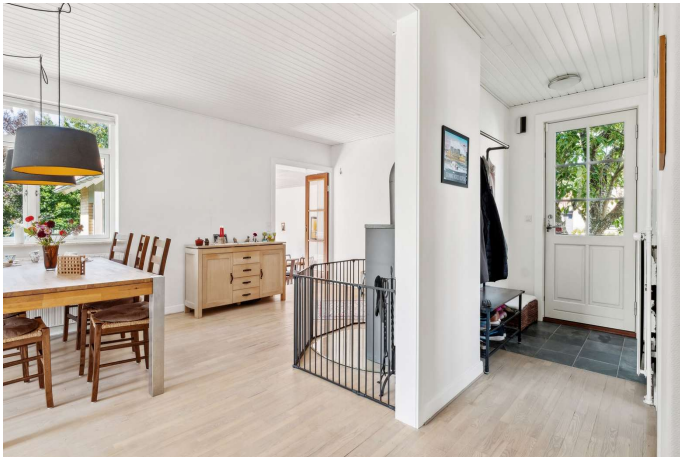
Indbydende entré til køkken/alrum