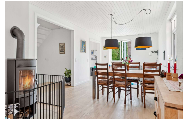
Fra alrum er der udsigt over haven/området.