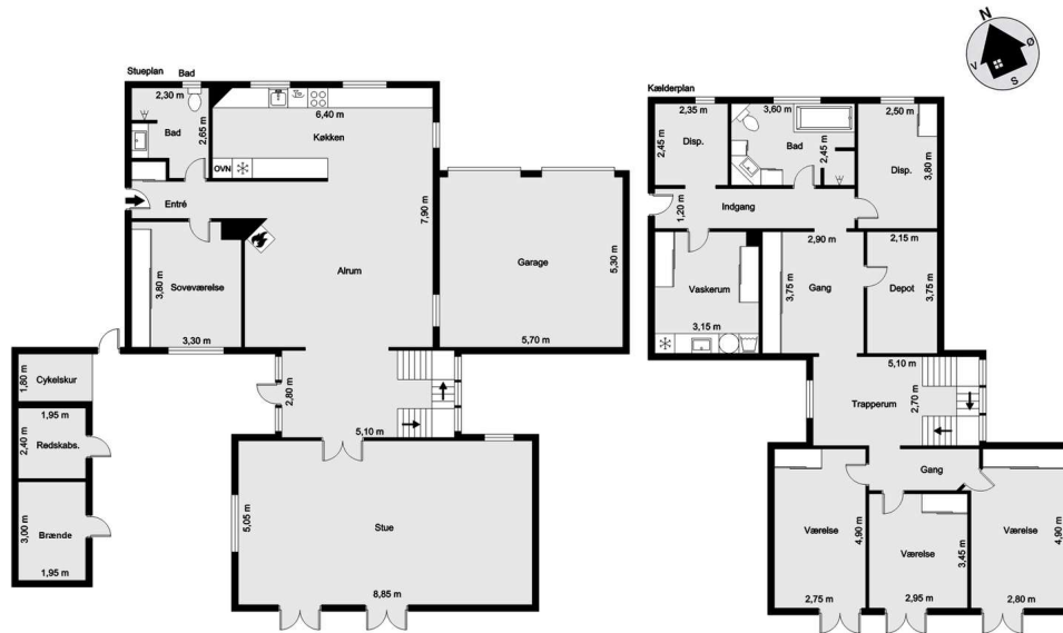
Vejledende tegning uden ansvar! (Profilm.dk)