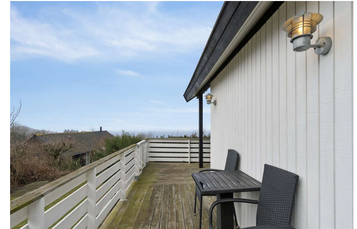
Terrasse med udsigt