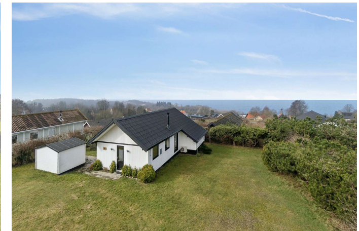
Fritidshus med havudsigt