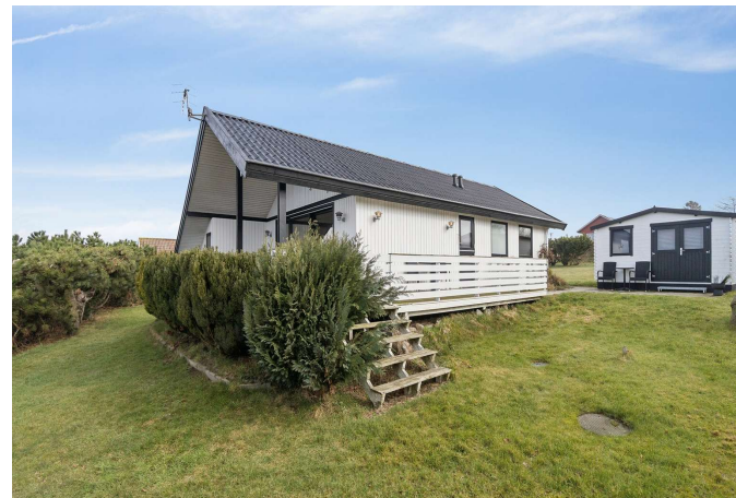
Set fra haven