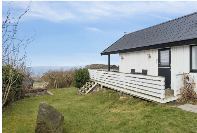
Udsigt fra haven