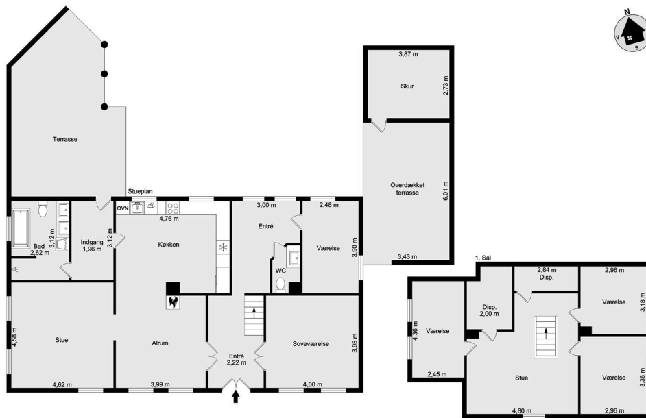
Vejledende tegning uden ansvar! (Profilm.dk)