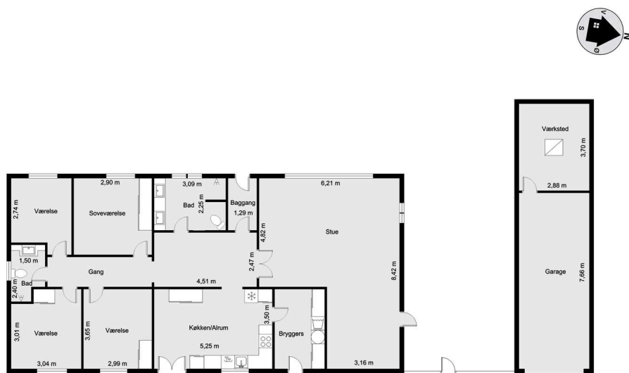
Vejledende tegning uden ansvar! (Profil.m.dk)