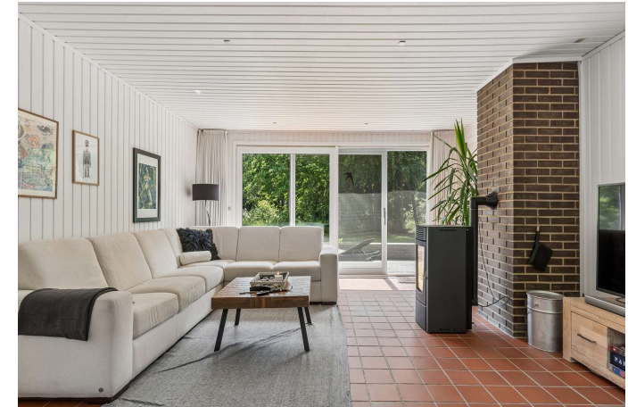
Stue med udgang til syd-/vestvendt terrasse.