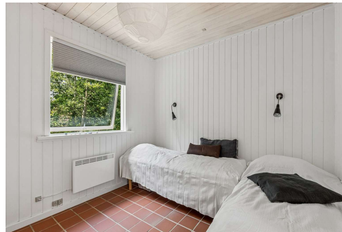
2 gode værelser + annek + ekstra værelse i garagen.