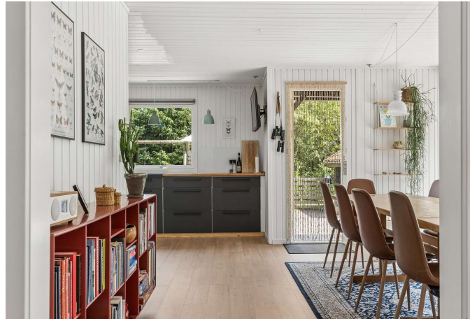
Køkken er i åben forbindelse til alrum.