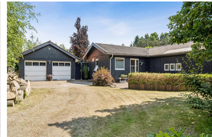
Dobbelt garage med bryggers og et ekstra værelse.