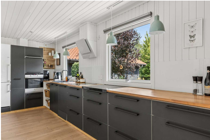
Hyggeligt køkken med godt lysindfald.