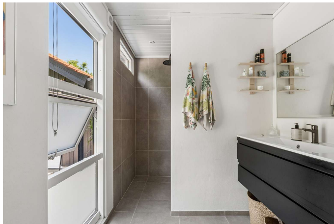
Flot lyst badeværelse med gulvvarme og brus.